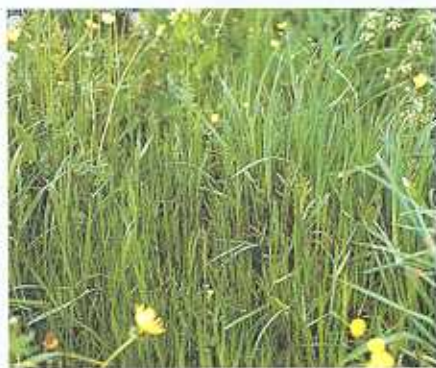
Die Gemeine Rispe bildet sehr dichte, filzartige, mittelhohe Bestände. Das Gras bringt nur zum ersten Aufwuchs gute Erträge. Später bleibt es klein und ertragslos.