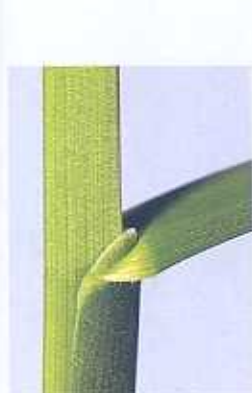
Das Blatthäutchen ist kurz und kragenförmig.