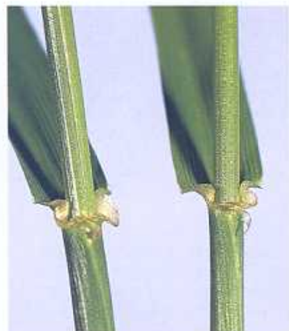
Wiesenschwingel hat nur ein kurzes oder kaum sichtbares Blatthäutchen, jedoch ein deutlich sichtbares Blattöhrchen.