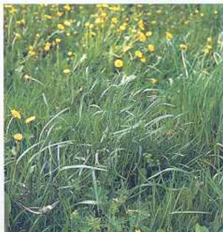
Der Wiesenschwingel wächst horstig und bildet deshalb keinen so dichten Rasen wie Deutsches Weidelgras.