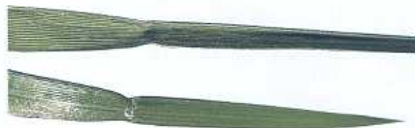
Die Blattunterseite des Wiesenschwingels glänzt und die Oberseite ist schwach gerieft. Im oberen Drittel ist das Blatt meist eingeschnürt.