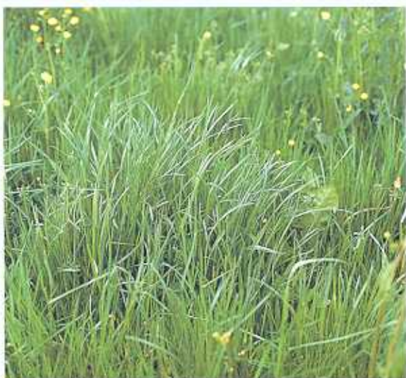
Ein Bestand von Deutschem Weidelgras glänzt (Blattunterseiten) und ist sattgrün. Er wirkt rasenartig und weist nur in seltenen Fällen einzelne Horste auf.

Das Deutsche Weidelgras ist die wichtigste Gräserart des Dauergrünlandes. Dieses Untergras ist vielschnittverträglich und -bedürftig. Es ist weidefest und gedeiht am besten in Lagen ohne strenge Winter. Häufige Nutzung in Verbindung mit Weidegang fördert die Seitentriebbildung und ein erneutes Wachsen der Seitentriebe (vegetative Vermehrung). Das führt zur flächigen Ausbreitung mit dem typischen rasenförmigen Wuchs.