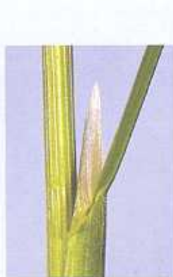
Das Blatthäutchen ist bis zu 1 cm lang und spitz zulaufend.