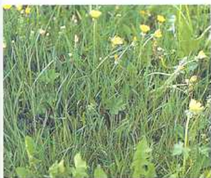
Wiesenrispenblätter sind bis 40 cm lang und stehen im Bestand steif aufrecht und typisch kreuz und quer durcheinander. Das Blatt ist intensiv dunkelgrün.