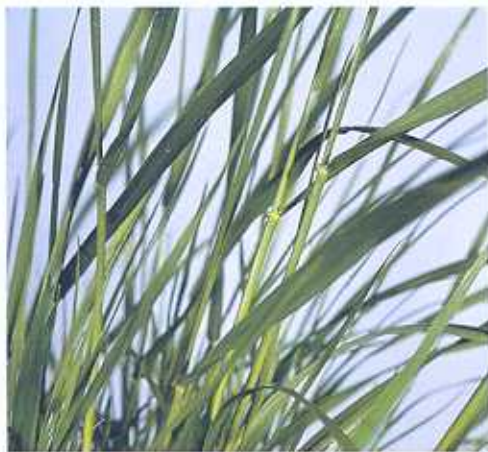
Wiesenschwingel wächst horstig und ist ein Obergras. Der Bestand glänzt. Das jüngste Blatt ist gerollt.

Das Gras ist nur bedingt weidetauglich. Seine Konkurrenzkraft gegenüber anderen Pflanzenarten ist nicht sehr groß.