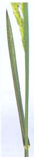
Rispenarten haben Blätter mit Kahnspitze und Doppelrille.